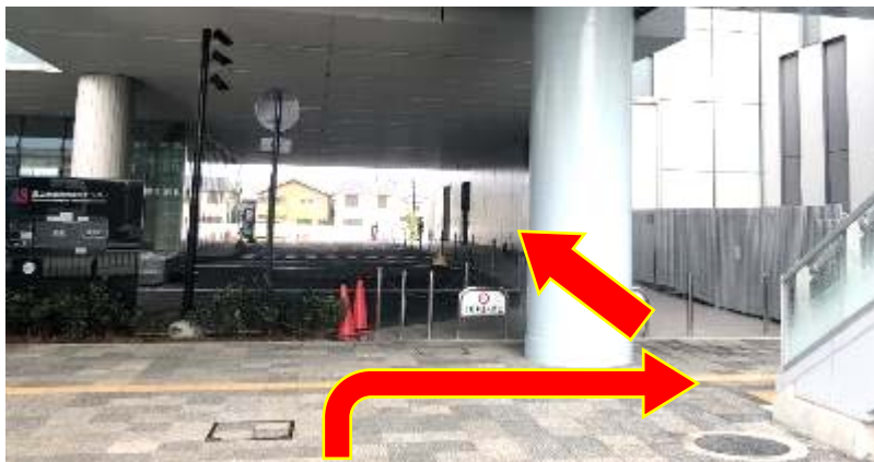
⑤ タクシー乗降場を左手に直進し、エントランス棟と病院棟の間を直進してください。