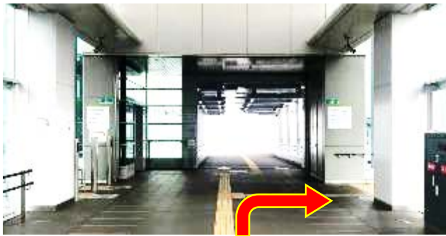
③ センター直結歩道橋手前を右折してください。