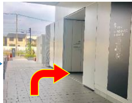
⑥ 救急外来、時間外出入口の表示方向に右折してください。