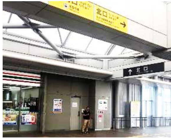
② 改札を出て右折、北口方面へ