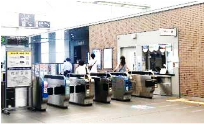
① JR岸辺駅の改札は1か所です