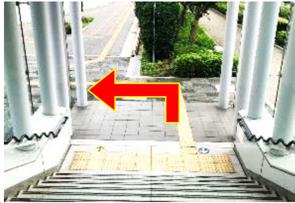
④ 階段を降りたら左折してください。