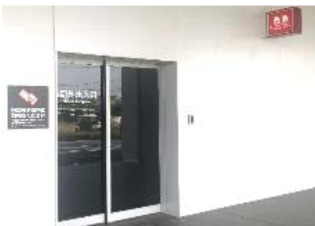
⑦ 直進すると右側に時間外出入口があります。「救急」の赤い表示が目印になります。